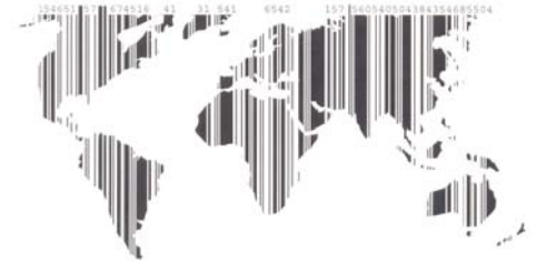
Un autre monde (UWE 156) distribué par Discograph

Les bénéfices de vente de l'album seront entièrement reversés à ATTAC ( www.attac.org ) afin de financer ses activités internationales et solidaires.