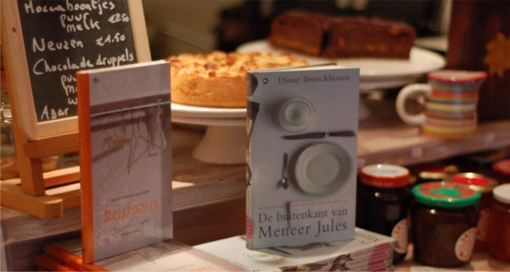
■ De literaire high tea in Eethuis Letternijen in Antwerpen: een combinatie van culinaire en literaire meesterwerkjes.